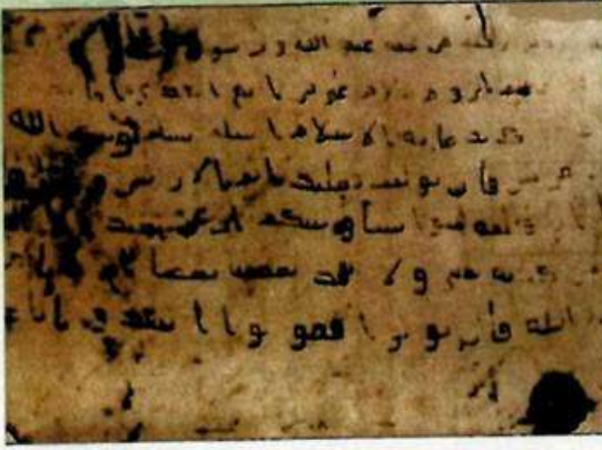
شكل (٦) صورة لإحدى الوثائق لمكاتبات النبي ﷺ

٥- دعوة الناس في أماكنهم: ذهب النبي ﷺ مع أصحابه إلى بيت كبير اليهود يدعوهم للإسلام فقام النبي ﷺ فتناداهم يا معشر يهود، أسلموا تسلموا، فقالوا: بلغت يا أبا القاسم، فقال: ذلك أريد، ثم قالها الثانية، فقالوا: قد بلغت يا أبا القاسم، ثم قالها الثالثة (٢٠).