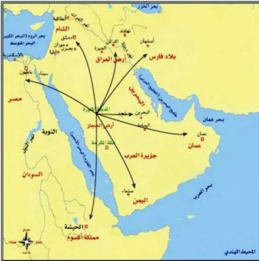
شكل (٧) الملوك والأمراء الذين بعث النبي ﷺ لهم رسائل

ابن أبي أنفه بردائه، ثم قال: لا تغبروا علينا، فسلم رسول الله ﷺ عليهم، ثم وقف فنزل فدعاهم إلى الله وقرأ عليهم القرآن، فقال عبد الله بن أبي بن سلول: أيها المرء إنه لا أحسن مما تقول، إن كان حقا فلا تؤذنا به في مجالسنا، ارجع إلى رحلك فمن جاءك فاقصص عليه (٢١).