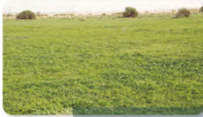
نزول المطر واخضرار الأرض