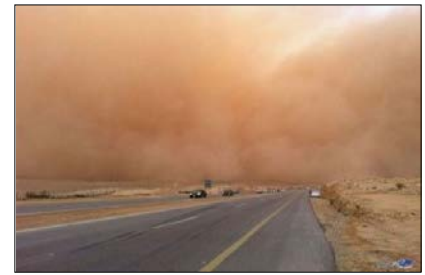
العاصفة ( ----- )