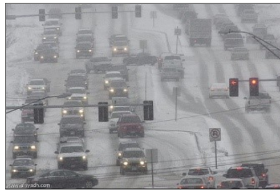
العاصفة ( ----- )