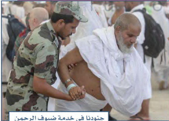
جنودنا في خدمة ضيوف الرحمن

الأمن الوطني في المملكة العربية السعودية يشمل الجانب الداخلي، وأي مهددات من الجانب الخارجي، فوطننا مستهدف من الأعداء، ولهذا يجب علينا حمايته من الداخل والخارج.