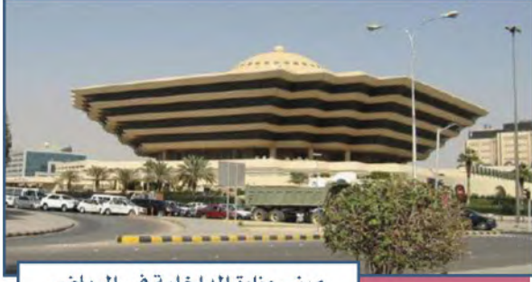
مبنى وزارة الداخلية في الرياض