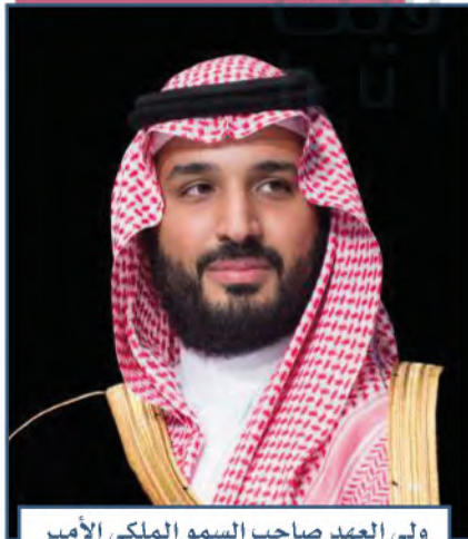
ولي العهد صاحب السمو الملكي الأمير محمد بن سلمان بن عبدالعزيز آل سعود

قال خادم الحرمين الشريفين الملك سلمان بن عبدالعزيز: «لقد وضعتُ نُصَبَ عيني مواصلة العمل على الأسس الثابتة التي قامت عليها هذه البلاد المباركة منذ توحيدها؛ تمسكاً بالشرعية الإسلامية الغراء، وحفاظاً على وحدة البلاد، وتثبيت أمنها واستقرارها».