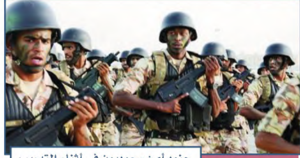
جنود أمن سعوديون في أثناء التدريب