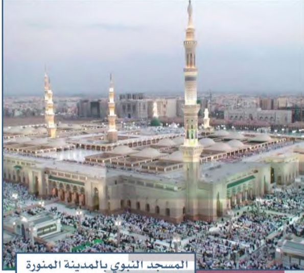
المسجد النبوي بالمدينة المنورة