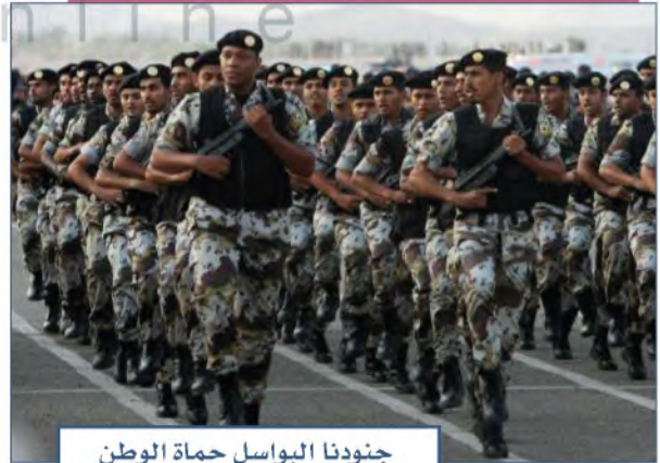
جنودنا البواسل حماة الوطن