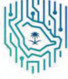
الهيئة الوطنية للأمن السيبراني National Cybersecurity Authority