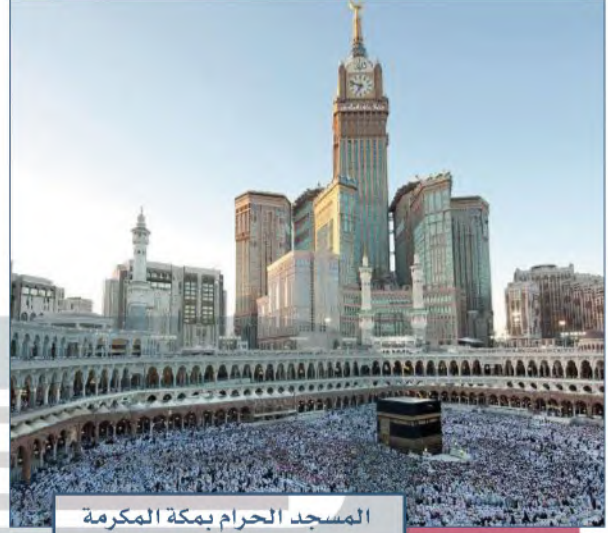
المسجد الحرام بمكة المكرمة