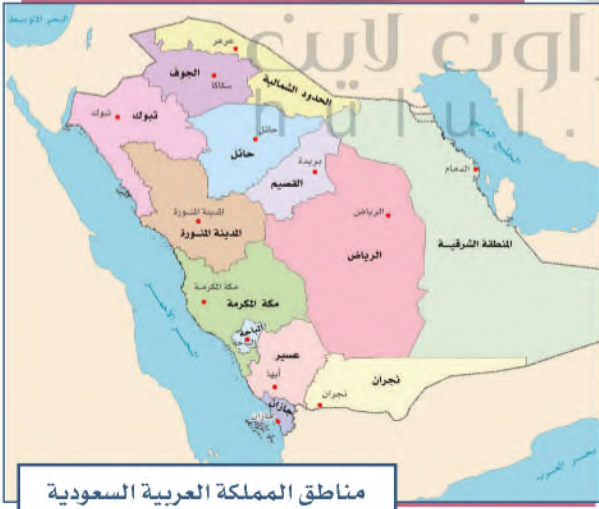
مناطق المملكة العربية السعودية