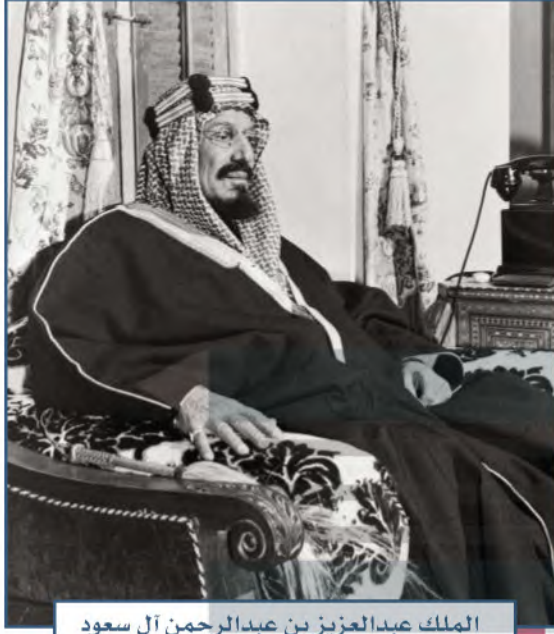
الملك عبدالعزيز بن عبدالرحمن آل سعود

وتعدّ مدن ووطننا المملكة العربية السعودية أكثر مدن العالم أمناً، إذ تتقلص فيها نسب الجريمة والمخدرات، وذلك بسبب وعي مجتمعنا وتعاونه مع سلطات الدولة. ومنذ أن وحد الملك عبدالعزيز - طيب الله ثراه - كيان هذه البلاد إلى يومنا هذا بقيادة خادم الحرمين الشريفين الملك سلمان بن عبدالعزيز آل سعود وولي عهده صاحب السمو الملكي الأمير محمد بن سلمان بن عبدالعزيز آل سعود - وفقهم الله جميعاً - يعيش بلدنا بأمن وطمأنينة.