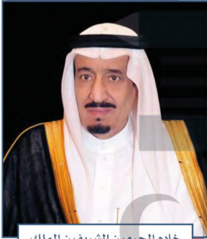
خادم الحرمين الشريفين الملك سلمان بن عبدالعزيز آل سعود

من ركائز الأمن في المملكة العربية السعودية نظامها الملكي الذي يقوم على الحق والعدل، فمنذ تأسيس الدولة السعودية الأولى والحاكم أو الملك من الأسرة المالكة آل سعود يقوم بمسؤولياته تجاه وطنه وشعبه بما يوافق المبادئ الإسلامية والمصالح الحيوية للوطن، ويزكيه تاريخه وتاريخ أسرته وأجداده. والحاكم في وطننا المملكة العربية السعودية لا يقوم على توجه فكري ضيق أو مستند قبلي أو إقليمي أو فائدة شخصية، بل على نظام إسلامي وأسس شرعية تنتظم فيها البيعة الشرعية والعمل لتنمية البلاد والمجتمع بما يحقق المصلحة العامة للدين والوطن.