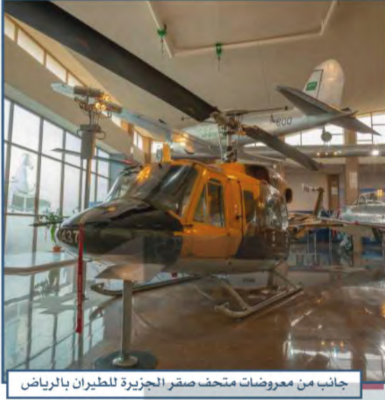
جانب من معروضات متحف صقر الجزيرة للطيران بالرياض

في متحف صقر الجزيرة للطيران في مدينة الرياض معروضات ارتبطت بمعلومات تاريخية ومعرفية عن القوات الجوية والطيران في المملكة العربية السعودية، وأبوابه مفتوحة للزوار يومياً.