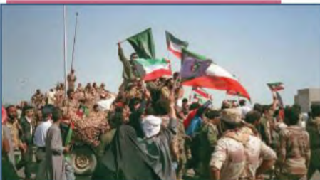
الحرس الوطني السعودي في أثناء تحرير دولة الكويت من العدوان الغاشم عام ١٤١١هـ