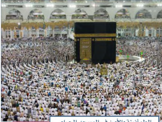
الطمأنينة والأمن في المسجد الحرام

الأمن الوطني هو الخطط والإجراءات والأعمال التي تتخذها الدولة لتحقيق الاستقرار السياسي والاقتصادي والاجتماعي لأفراد المجتمع ومؤسساته وأراضي الوطن، وللدفاع عن مصالحها الحيوية الداخلية والخارجية من أي عدوان خارجي، أو تهديد داخلي. تتبع دولتنا سياسة متوازنة تمنع التفرق، وتحث على الوحدة، وقوة الولاء للوطن والقيادة على أسس الإسلام.