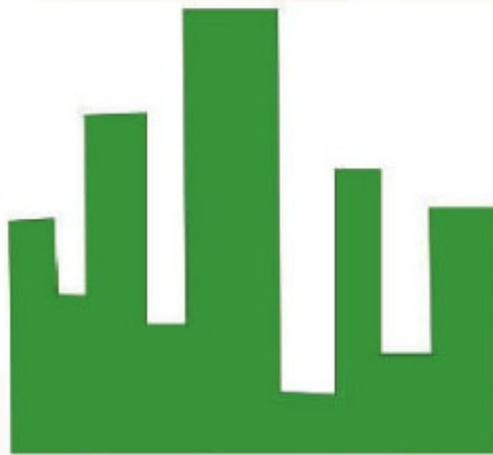
شكل (٤-٣-٣): تلوين الكائنات

ألون الرسم بالضغط على اللون الأخضر من شريط الألوان فيظهر المبنى كما في الشكل (٤-٣-٣).