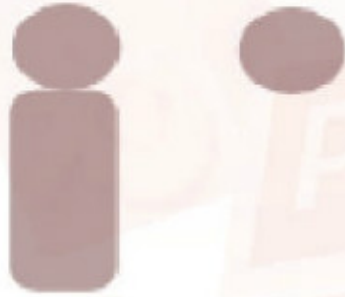
شكل (٢-٢-٤): رسم الرأس والجسم

٢ ولرسم الشكل الذي يمثل رمز الإنسان ، أرسم دائرة تمثل الرأس .