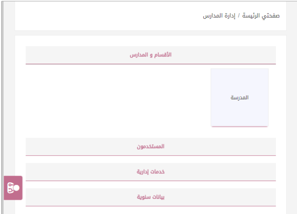
الشكل (1-2) لوحة التحكم