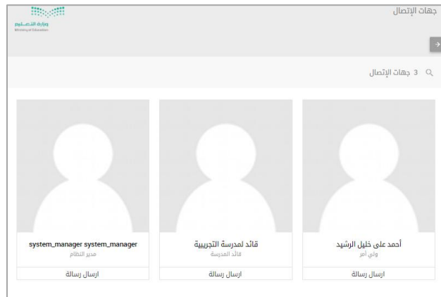
الشكل (8-1) قائمة جهات الاتصال

جهات الاتصال : يتم عرض جميع جهات الاتصال التي على قائمة الوكيل ويمكن للمعلم أن يرسل رسالة لأي جهة اتصال بالضغط على إرسال رسالة.