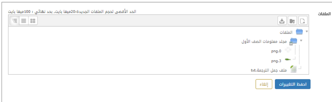
الشكل (12-1) مستعرض الملفات

من هنا يمكن ل المرشد الطلابي المدرسة أن يضيف ملفاته الخاصة به والتي يتراوح حجمها بين 20 إلى 100 ميجا للملف الواحد .