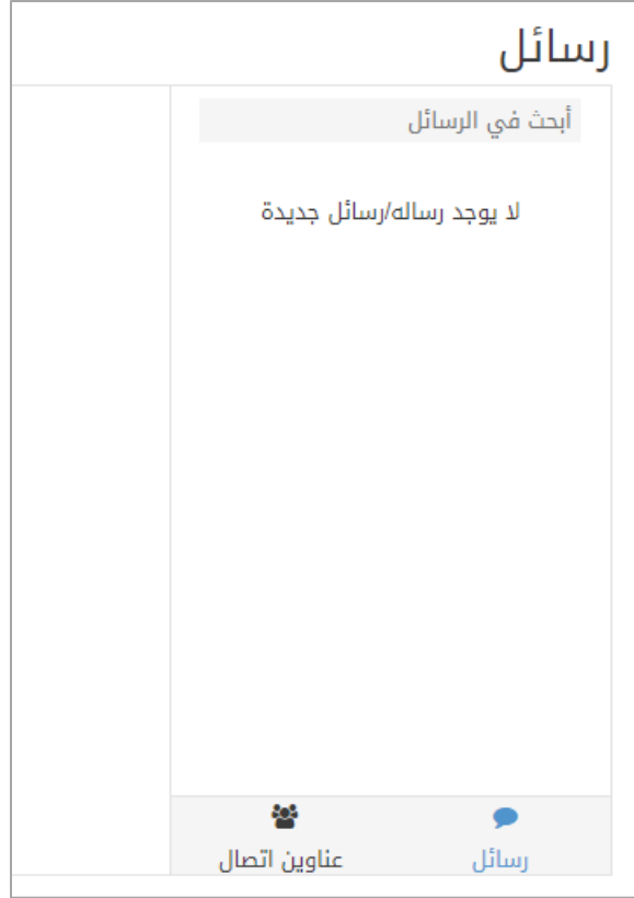
الشكل (11-1) شاشة الرسائل

في هذه الشاشة يمكن أن يحدد المرشد الطلابي أن ينتقل الى عناوين الاتصال أو الرسائل.