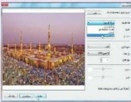
شكل (1-1-1) معاينة الصورة قبل بدء المسح الضوئي

بعد ذلك تظهر شاشة مربع الحوار (مسح ضوئي جديد) ، كما في الشكل (1-1-1)، ومنها يتم تحديد الإعدادات الخاصة بمسح المستندات، من خلال الاختيار وفق العناصر التالية: 1. ملف التعريف لتحديد نوع الوثيقة المراد عمل مسح لها (صورة، مستندات...). 2. تنسيق الألوان لتحديد لون الوثيقة بعد مسحها (الألوان، تدرج رمادي، أسود وأبيض). 3. نوع الملف لتحديد صيغة (امتداد) الملف الذي سيتم الحفظ به (.Bmp, Jpg, Png...). 4. الدقة لتحديد دقة المسح للمستند، وكلما زاد الرقم زادت جودة المستند وزاد حجمه.