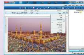
شكل (1-1-2) تغيير اسم الملف الافتراضي الخاص بالمستند إلى الصورة التي تم مسحها ضوئياً

✓ انقر فوق مسح ضوئي، ثم أنتظر بضع ثوانٍ حتى يتم المسح بشكل كامل، وعندما يتم حفظ المستند الذي تم مسحه بالماوس (تلقائياً) في المجلد (المستندات)، تحت (المستندات الملتقطة بالماوس الضوئي)، كما في الشكل (1-1-1).