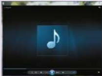
شكل (١٠-٤-١) برنامج ويندوز ميديا بلاير

٢) سيتم فتح الملف الصوتي - تلقائيًا - للاستماع إليه باستخدام برنامج ويندوز ميديا بلاير (Windows Media Player) أو أي برنامج آخر يشغل الأصوات ثم تعيينه كمشغل افتراضي، كما في الشكل (١٠-٤-١).