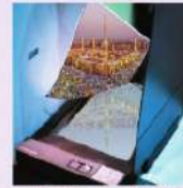
شكل (1-1) وضع الصورة أو المستند المطلوب نسخها - على زجاج الماسح الضوئي، حيث يكون جانب الطباعة نحو الأسفل، كما في الشكل (1-1-1)، مع مراعاة ضبط موقع الورقة بحسب الإرشادات الموجودة على حافة الزجاج. ثم أغلق غطاء الماسح الضوئي.

أرفع غطاء الماسح الضوئي، وأضع الصورة أو المستند - المطلوب نسخها- على زجاج الماسح الضوئي، حيث يكون جانب الطباعة نحو الأسفل، كما في الشكل (1-1-1)، مع مراعاة ضبط موقع الورقة بحسب الإرشادات الموجودة على حافة الزجاج. ثم أغلق غطاء الماسح الضوئي.