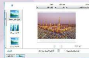
شكل (1-1-3) مربع حوار (طباعة الصور) لطباعة المستند الذي تم مسحه

Ⓐ عند رغبتني في تغيير اسم الملف الافتراضي الخاص بالمستند أو الصورة التي تم مسحها ضوئياً، انقر بزر الفأرة الأيمن فوق اسم المستند في طريقة العرض (مسح ضوئي) ثم انقر فوق إعادة تسمية، كما في الشكل (1-1-2).