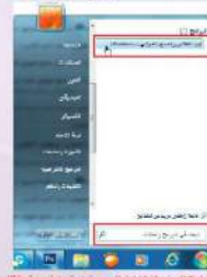
شكل (1-1-1) طريقة تحميل المسح الضوئي لـ (Windows)

أرفع غطاء الماسح الضوئي، وأضع الصورة أو المستند - المطلوب نسخها- على زجاج الماسح الضوئي، حيث يكون جانب الطباعة نحو الأسفل، كما في الشكل (1-1-1)، مع مراعاة ضبط موقع الورقة بحسب الإرشادات الموجودة على حافة الزجاج. ثم أغلق غطاء الماسح الضوئي.