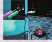
شكل (1-1) توصيل سماعة الرأس بالحاسب

يمكن استخدام برنامج (مسجل الصوت) في الحاسب لديك لتسجيل الصوت، وحفظه كملف صوتي في الحاسب، دون تحميل أي برامج خارجية، وذلك من خلال تنفيذ الخطوات التالية: 1 أهدل سماعة الرأس بالحاسب، وذلك بتوصيل الطرف الأول لسماعة الرأس - ويكون غالباً باللون الأزهرى - بمنفذ اللاقط (الميكروفون) في الحاسب، وغالباً يظهر بجانبه أو فوقه صورة اللاقط، ثم اهدل الطرف الآخر - ويكون غالباً باللون الأخضر - بمنفذ السماعة في الحاسب، ويظهر بجانبه أو فوقه صورة سماعة، كما في الشكل (1-1).