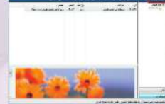
شكل (1-1-1) شاشة العمل للفاكس والمسح الضوئي بعد مسح ضوئي جيد

من قائمة (بدأ) ، أكتب في مربع البحث (الفاكس والمسح الضوئي)، وفي قائمة النتائج سوف يظهر برنامج (الفاكس والمسح الضوئي) لـ (Windows)) تحت قائمة البرامج، انقر على البرنامج كما في الشكل (1-1-1).