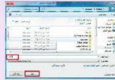
شكل (٦-٤-١) نافذة حفظ تسجيل الملف الصوتي في المستندات

تظهر شاشة مربع حوار حفظ التسجيل، كما في الشكل (٦-٤-١). وفي خانة (اسم الملف)، أكتب اسماً للملف الصوتي الذي تم تسجيله، وليكن (test1)، ثم انقر فوق (حفظ) لحفظ الملف، وعندما سيتم حفظ الملف بصيغة امتداد (WMA) - وهي إحدى صيغ ملفات الأصوات - في مجلد (المستندات)، ويمكن حفظ الملف الصوتي في مجلد آخر بالنقر على اسم المجلد الذي أريد حفظ الملف فيه، أو حفظه في مجلد جديد بالنقر على (مجلد جديد).