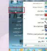
شكل (٨-١-٤) الاستماع إلى الملف الصوتي الذي تم تسجيله

يمكنك توصيل جهاز صوت، أو فيديو آخر، أو كاميرا فيديو أو مثلث شرائط (كاسيت)، أو مثلث الأقراص المضغوطة CD، أو أقراص DVD، في منفذ الإخال على بطاقة الصوت، ويمكنه بعد ذلك تسجيل الصوت من ذلك الجهاز على الحاسب الخاص به باستخدام (محول الصوت).