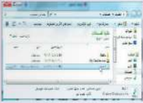
شكل (٩-٤-١) نافذة مجلد المستندات

١) ستظهر شاشة مجلد (المستندات)، كما في الشكل (٩-٤)، انقر نقرًا مزدوجًا على اسم الملف الذي حفظت فيه المقطع الصوتي.