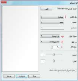
شكل (1-1-1) شاشة مربع الحوار (مسح ضوئي جديد)

بعد ذلك تظهر شاشة مربع الحوار (مسح ضوئي جديد) ، كما في الشكل (1-1-1)، ومنها يتم تحديد الإعدادات الخاصة بمسح المستندات، من خلال الاختيار وفق العناصر التالية: 1. ملف التعريف لتحديد نوع الوثيقة المراد عمل مسح لها (صورة، مستندات...). 2. تنسيق الألوان لتحديد لون الوثيقة بعد مسحها (الألوان، تدرج رمادي، أسود وأبيض). 3. نوع الملف لتحديد صيغة (امتداد) الملف الذي سيتم الحفظ به (.Bmp, Jpg, Png...). 4. الدقة لتحديد دقة المسح للمستند، وكلما زاد الرقم زادت جودة المستند وزاد حجمه.