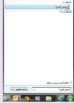
شكل (2-1) تشغيل برنامج مسجل الصوت

4 سوف تظهر شاشة البرنامج كما في الشكل (2-1).