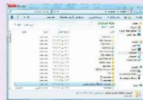
شكل (1-1-1) نافذة حقل المستند الذي تم مسحه بالماوس في المجلد (المستندات)

✓ انقر فوق مسح ضوئي، ثم أنتظر بضع ثوانٍ حتى يتم المسح بشكل كامل، وعندما يتم حفظ المستند الذي تم مسحه بالماوس (تلقائياً) في المجلد (المستندات)، تحت (المستندات الملتقطة بالماوس الضوئي)، كما في الشكل (1-1-1).