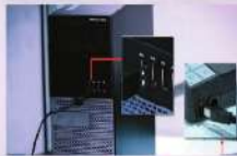
شكل (١١-٤-١) توصيل الماسح الضوئي بالحاسب

١) أحمل الماسح الضوئي بالحاسب، ومصدر التيار الكهربائي (بعض الماسحات الضوئية لا تحتاج لمصدر تيار كهربائي)، كما في الشكل (١١-٤-١).