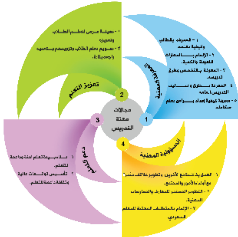
شكل (٢) المعايير المهنية العامة

تتكون المعايير العامة التي يشترك فيها جميع المعلمين من كافة التخصصات من عدد من المعايير يوضحها الشكل (٢). ولمزيد من المعلومات يوصى بالرجوع إلى كتيب «المعايير المهنية الوطنية للمعلمين بالمملكة العربية السعودية» ودراسة المعايير بدقة وتأن.