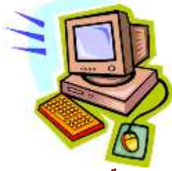
ملفات خاصة بالاركان

(الركن الفني – ركن القراءة – الركن الإدراكي- ركن الاكتشاف – ركن التخطيط – ركن البناء ) ملفات تحضير خاصة بالحروف والأرقام بالإضافة إلى اناشيد وفيديو وعروض بوربوينت وورق عمل ملف خاص للغة الانجليزية