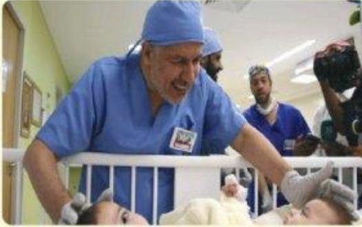
د. عبدالله الربيعه - طبيب وجراح سعودي.

النجاحات التي حققها د. عبدالله الربيعه باسم الوطن في مجال فصل التوائم جعلت المملكة العربية السعودية من أولى الدول في هذا المجال. والمملكة العربية السعودية بقيادة خادم الحرمين الشريفين وولي عهده الأمين تقدم المبادرات الإنسانية النبيلة لجميع أفراد الإنسانية. وقد استمرت المملكة في الربع قرن الأخير بإجرائها عمليات فصل التوائم الأكثر تعقيداً وصعوبة في العالم. بفضل تلك العمليات أصبح وطننا وجهة للكثير من مواطني دول العالم من جميع الجنسيات ومختلف الأديان.