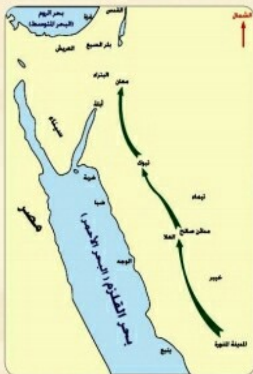
خريطة مسار جيوش أسامة بن زيد رضي الله عنه

فكان لهذا الإجراء أثر إيجابي في رفع معنويات المسلمين، وفي التأثير على خطط المرتدين لمهاجمة المدينة، إذ لو كان بالمسلمين ضعف لما جردوا حملة أسامة رضي الله عنه إلى الشام.