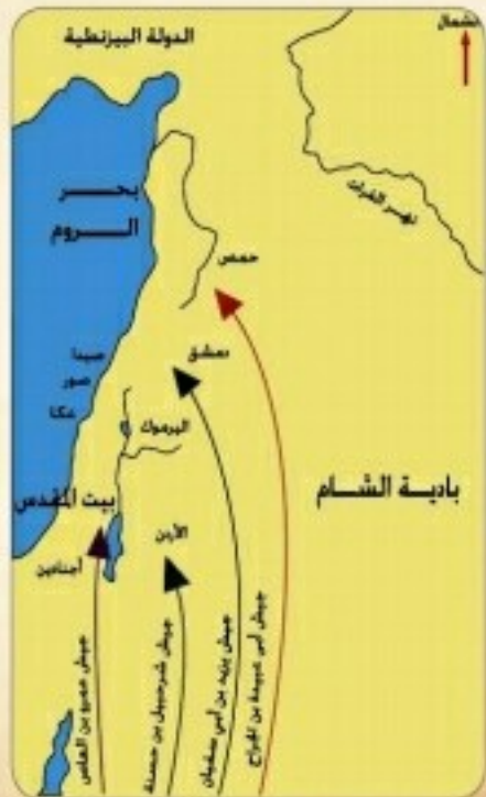
خريطة مسار الألوية الأربعة المتوجهة للشام