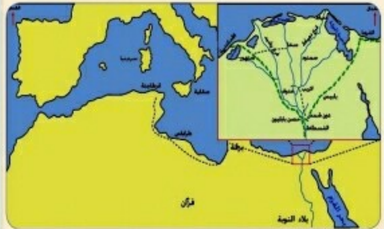
خريطة معارك الفتح الإسلامي في مصر وشمال إفريقية

اتجه عمرو بن العاص رضي الله عنه بعد ذلك نحو الغرب ففتح برقة صلحاً سنة ٢١ هـ وفتح طرابلس عنوة سنة ٢٢ هـ.