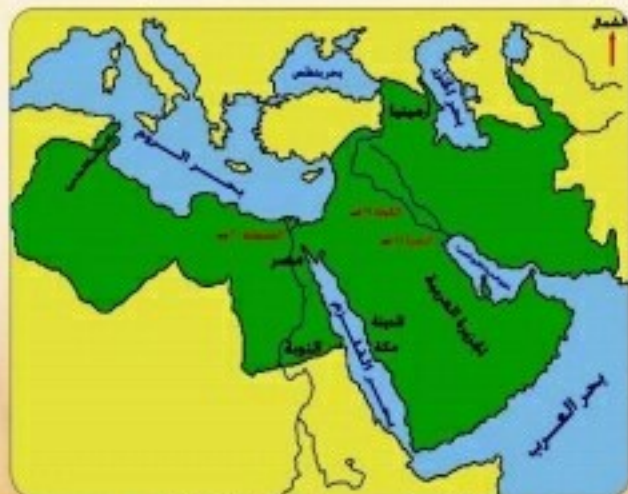
خريطة للمدن التي بنيت في عهد الخلفاء الراشدين

٢) الكوفة في العراق: جعلت كثرة المستنقعات المائية في البصرة العرب يفكرون في اتخاذ مدينة أخرى أصح منها هواءً، فاختط سعد بن أبي وقاص رضي الله عنه الكوفة سنة ١٧هـ. وقد انتقل إليها الخليفة علي بن أبي طالب رضي الله عنه عندما وقع الاضطراب داخل الدولة الإسلامية أثناء خلافته.